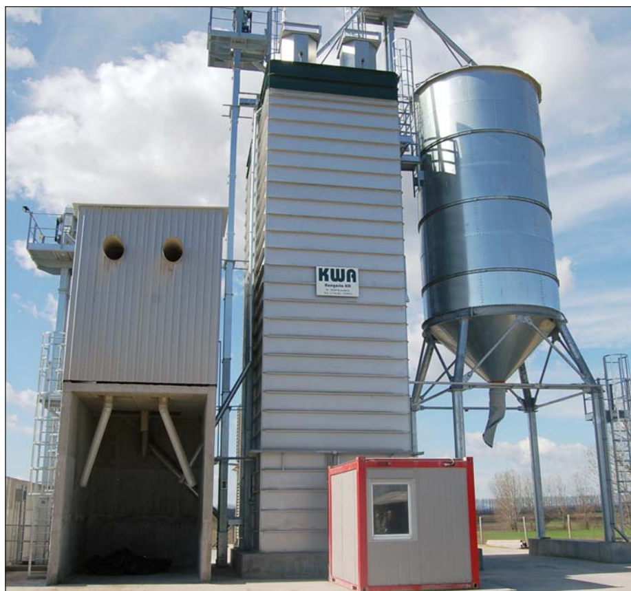
Az új gabonaszárító

környezetet teremtsék meg. Áldoznak arra, hogy ipar települjön a faluba és határába, ezért is adták jelképes összegért a termelői csoport számára a hat hektár földet. Hat száz forintot kértek a területért, ami megint csak a hosszú távú gondolkodást jelzi. Így ugyanis családoknak adnak munkalehetőséget, nem beszélve arról, hogy a tcs jelentős összegű adót fizet a falu működéséhez. S rajzolódik az ipari park további része is: egy 2,5 hektáros területen zöldség-gyümölcs tárolók épülnek, s a további területre is vannak érdeklődő befektetők. Miként egy másik természetes kincsük kiaknázására, a 36 Celsius-fokos termálvíz hasznosítására is. A polgármester az átadó ünnepségen bejelentette, hogy a termelői csoportnak megalakult egy junior szekciója, amelynek gazdálkodását úgy segítik, hogy egy 69 hektáros szántóterületet biztosítanak. Ezen a földterületen a csoporttagok gyermekei gazdálkodhatnak. Fontos, hogy kistérségben is gondolkodjon egy falu vezetése. A polgármester már 1992-ben kötött kistérség-