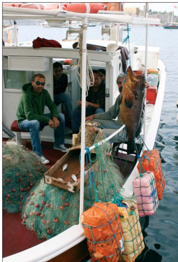
Török halászhajó kifut a tengerre