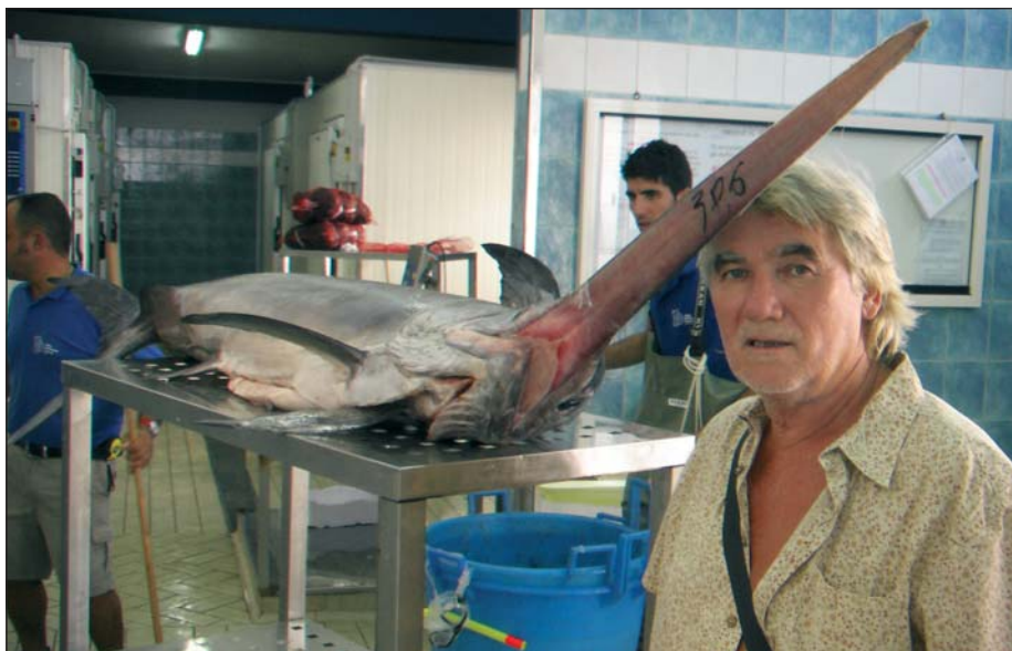
Ez a kard már nem öklel fel senkit

Szállásunk nagyon kellemes körülmények között, de távol minden nagyobb településtől a sziget közép-keleti részén volt egy tengerparti kis faluban. Innen indultunk a napi túráinkra. A második napon egy keskeny nyomtávú vasúttal zötyögtünk kb. 3,5 órát a sziget belseje felé, majd vissza, miközben gyönyörködtünk a szép, érdekes, de mégis sivár tájban, s a nap végére meglepőd-