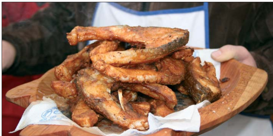
Sült ponty hortobágyi módra