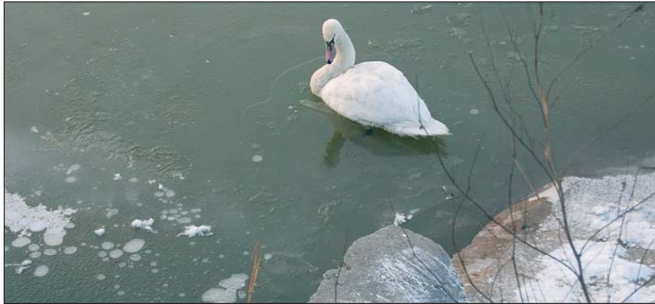
Magányos hattyú a kifolyónál. Megéri-e a tavaszt?

Ennek ellenére az utóbbi tíz év egyik legrosszabb évét zárták 2008-ban. „Talán a ciánszennyezéskor volt ennyire gyenge évünk” – jelentette ki a tógazda. Ennek oka, hogy a tenyészhalt megette a kormorán, a gém és a vidra. Jelentős kárrol számol be az igazgató, hiszen a mintegy 80 millió forintos árbevétel több mint negyede, 20–25 millió forint érték csúszott le a madarak torkán. Ha ez így folytatódik, be kell csukni a boltot, fel kell hagyni a haltermeléssel. A kormorán ellen nehéz védekezni, eddig túlságosan is leszályozták a