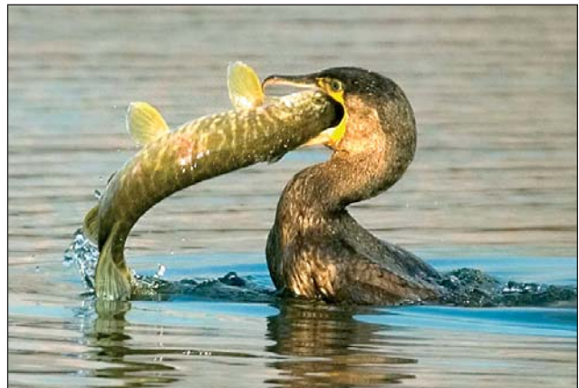
A jó étvágyú, válogatós kormorán

A madárvédelmi irányelv 9. cikke lehetővé teszi a tagállamok és a régiók számára,