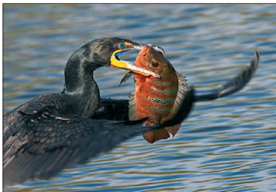
A félkilós halak sincsenek biztonságban

A kárókatona által okozott károk enyhítését célzó intézkedések engedélyezése és finanszírozása a tagállamok, illetve a régiók hatáskörébe tartozik, mivel azonban – költöző madár lévén – a kárókatona-állomány fenntartható kezelése csak valamennyi érintett tagállam és régió összehangolt fellépésével, az Európai Unió segítségével valósítható meg. „Az európai akvakultúra fenntartható fejlődésére vonatkozó stratégia” című bizottsági közlemény „Ritkítás védett fajok által” című szakasza