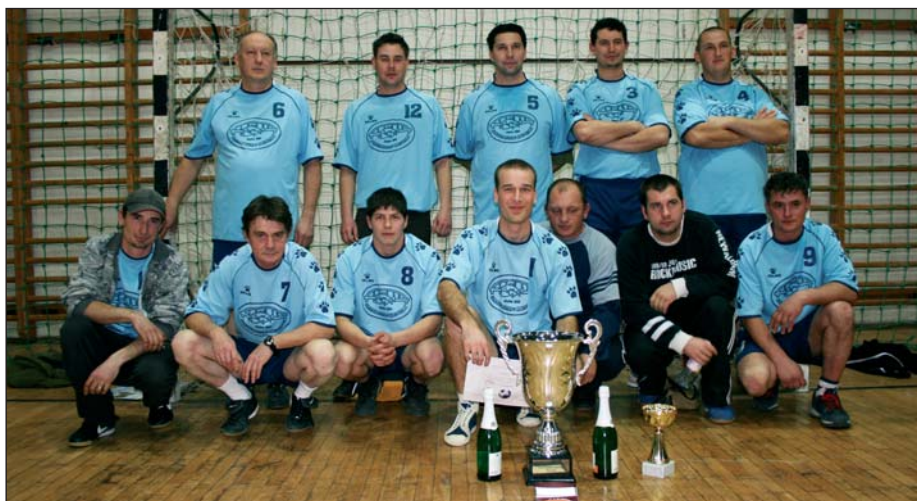
A győztes Szegedfish csapata a kupával