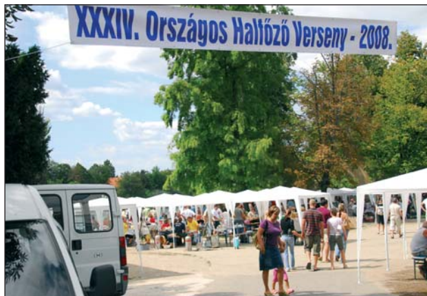
Nehéz lesz felülmúlni a tavalyi országos halfőző verseny színvonalát

– Az ismert, de kevésbé szeretett körülmények miatt a szövetség szervezete most olyan, amilyen. A lehetőségek nem változtak, de az igénybevételi oldalról jelentősen nőtt az elvárás. Annakidején, amikor a szervezet és a működés új alapszabályait megalkottuk, akkor volt egyfajta vélekedés arról, hogy a működőképesség okán például a határozatképességet és egyebeket hogyan kell szabályozni. Ez egy dolog, de hogy ezt minden nap alkalmazni kell, kicsit túlzónak tartom. Praktikusnak ez annyit jelent, hogy jómagam elégedetlen vagyok a szövetségi rendezvényeken való részvétellel. Akartuk, nem akartuk, eluralkodott egyfajta haszonelvűség: akkor jön el a tag, ha neki közvetlen anyagi haszna van a rendezvényből. Igaz, hogy a szövetség rendezvényein nem lehet