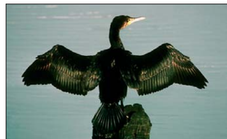
Kormorán teljes szépségében

A jogi egyértelműség érdekében haladéktalanul pontosan meg kell határozni a madárvédelmi irányelv 9. cikk (1) bekezdés a) pontjának harmadik, francia bekezdésében szereplő „súlyos károsodás” fogalmát az egységes értelmezés érdekében. A Parlament felhívja továbbá a Bizottságot, hogy a madárvédelmi irányelv 9. cikkének (1) bekezdése szerinti eltérések jellegére