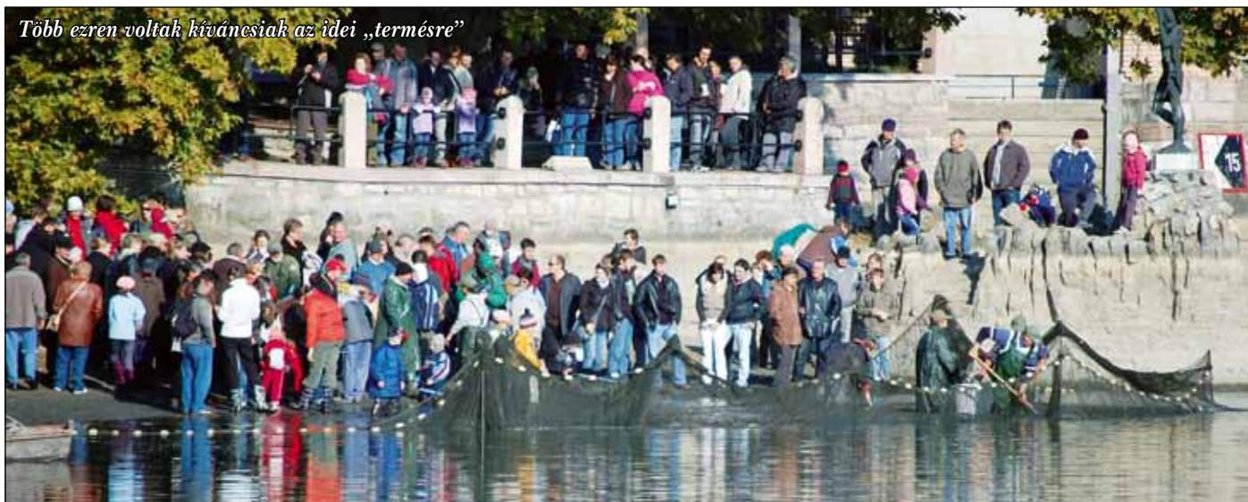
Több ezren voltak kíváncsiak az idei „termésre”

Az ágazat helyzetéről szólva az elnök elmondta, hogy nem könnyű a gazdálkodási helyzet, hiszen a halászat sem mentesül a ma zajló gazdasági folyamatok negatív hatásai alól. Az egyik legnagyobb probléma az – ez persze, a fogyasztóknak öröm – hogy ma is ugyanazon az áron adják el a halat, mint 4–5 évvel ezelőtt. Ezzel szemben a költségek jelentősen megnöttek, elsősorban a takarmány és a gázolaj ára nőtt elviselhetetlenné, amit a