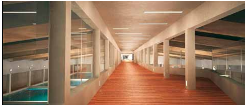
Az ivadék tokhalak fedett előnevelő medencéi

Medencetér V_{sz} = 2 \times 1440 \times 5,50 = 15 \text{ 840 m}^3/\text{h} ,