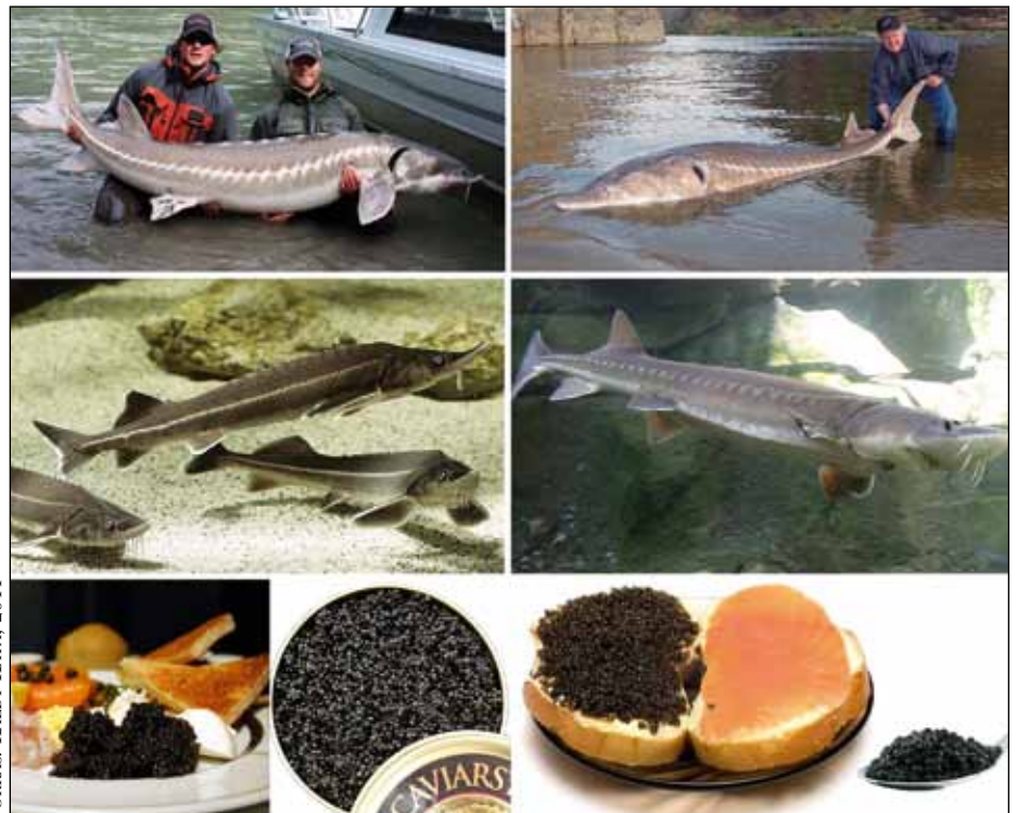
FORRÁS: KÁLDY KATA, 2011