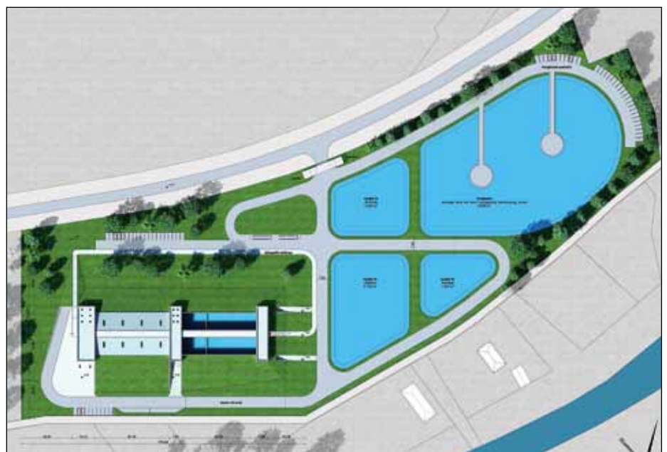
A tokhalnevelde felülnézetből

Megközelíthetőség: Az építési helyszín egy sík terület Mosonmagyaróváron, a Lajta és a Mosoni-Duna torkolatánál. A helyszín ideális megközelíthetőség szempontjából: