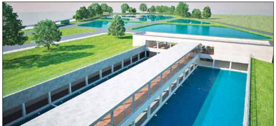
Az üzemi tavak

konferenciaterem V_{sz} = 8 \times 116,15 \times 3 = 2788 \text{ m}^3/\text{h} ,