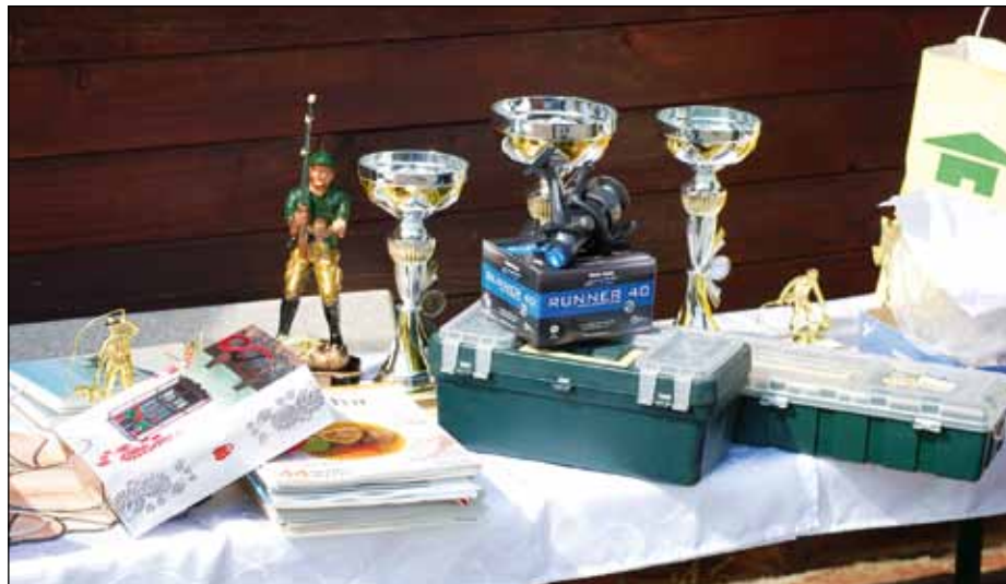
Díjak, kiosztás előtt...

csónakban evezést egyre többen értik, s ez az előrevetető út.