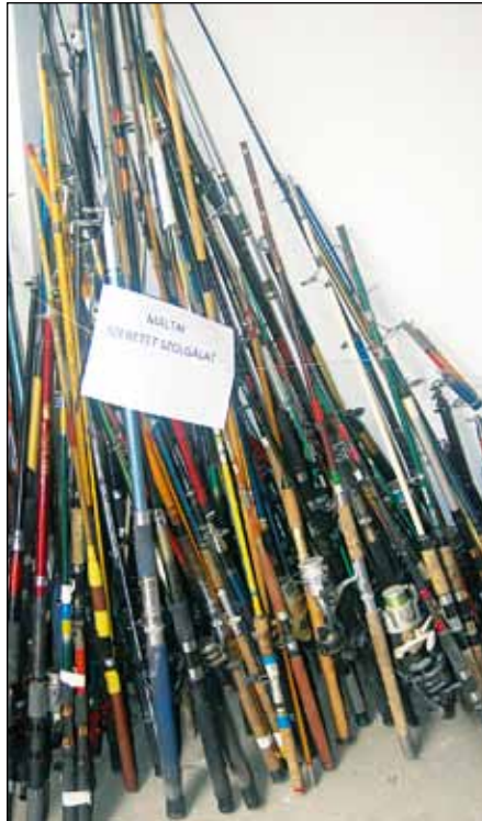
Ezeket a botokat a Máltai Szeretetszolgálatnál hasznosítják

A halóri ellenőrzések alapján tavaly több száz esetben tett halvédelmi szabálysértési feljelentést a szövetség. Ez a hatóságoknak és horgász egyesületeknek egyaránt megterhelő munkát okoz. A jó hír az, hogy az utóbbi időkben kiszabott bírságok mértéke úgy a halászati felügyeletek, mint a bíróságok részéről jelentősen emelkedett, ami visszatartó erőnek bizonyul. A készülő új halászati törvénytervezetben tovább szigorítják a büntetési tételeket, s ez remélhetően a rapsicokat is féken tartja. A rendőrkapitányságokkal és a Dunai Vízügyi Rendőrkapitánysággal több éves együttműködést kötöttek, velük tavaly 5 alkalommal került sor együttes összevont ellenőrzésre. Más természetvédelmi halgazdálkodók halóri állományával, vezetőivel is tartják a kapcsolatot. A Körös-menti Horgász Szövetség halőrei évek óta jönnek tapasztalatcserére a soroksári Duna-ágba, míg a ráckevei halőrök meghívás alapján mennek el a Körösökhöz. Készek rá, hogy a Balatoni Halgazdálkodási Nonprofit Zrt.-vel is létrejöjjön ez a fajta együttműködés.