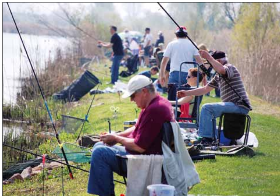
A tóparton minden horgászhely elkelt

de végig kell gondolniuk a szakembereknek, hogy elértük-e a megfelelő állapotot, vagy még tovább kell tisztítani a vizet. A tiszta víz halászati-, hal-, de új fogalomként mondom, horgászatbiológiai szemmel azt jelenti, hogy ebben a vízben nincs elég táplálék, alga, plankton a halmak. S